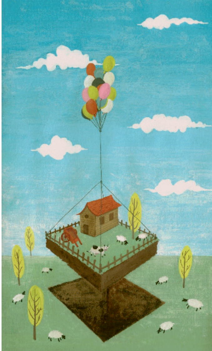
Figura 3. Reflexionar sobre el ascenso de una parcela de aire puede estimular la creatividad y hacer pensar en situaciones alejadas de la realidad atmosférica.

En cualquier caso, dado que la primera acepción es la de uso más frecuente, es inevitable que un estudiante principiante de termodinámica de la atmósfera imagine, cada vez que lee o escucha algo del tipo “parcelas que ascienden”, un terrenito campestre, con su casita, su pasto, su verja, sus aperos de labranza y su vaquita ascendiendo hacia capas más altas de la atmósfera (figura 3).