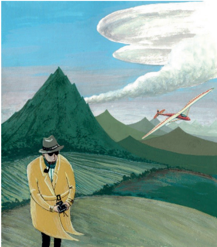
Figura 2. La denominación ondas de Lee parece insinuar la existencia de Lee como el autor de una innovadora teoría sobre las ondas a sotavento de las montañas.

Este tipo de ondas debería traducirse como ondas de montaña, un nombre quizás demasiado riguroso y exento de todo tipo de romanticismo e incluso un tanto deshumanizado pues destierra la sospecha de la existencia de un misterioso señor Lee como el autor de una innovadora teoría sobre las ondas a sotavento de las montañas. De igual forma, el famoso teorema de Mean que aparece en numerosos tratados de matemáticas y estadística, no hace referencia a la aportación de ningún misterioso señor Mean, sino a la palabra inglesa mean que en castellano se traduce por “media aritmética”.