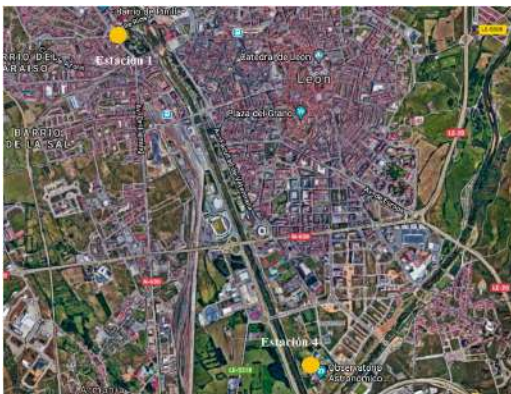
Fig. 1.- Localización de las estaciones León 1 y León 4

ubicadas en diferentes puntos de la ciudad, que son propiedad de la Junta de Castilla y León y que están integradas en la llamada “Red de vigilancia y control de la contaminación atmosférica en Castilla y León”. Durante el año 2016, solo dos estaciones estaban operativas (León 1 y León 4) (Fig. 1).