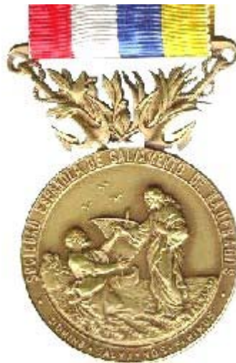
Núm. 8 . Medalla de la Sociedad Española de Salvamento de Náufragos , fundada en 1880. Premio a la abnegación y al heroísmo.

En aquellos días comentaba La Ilustración Española y Americana que el pronóstico del tiempo teleografiado por el Servicio Internacional de París, era muy imperfecto en cuanto a cálculos en la dirección y extensión de las borrascas. Y los prácticos de puerto y marinos experimentados opinaban que los observatorios meteorológicos servían para registrar datos, pero no para ser guías constantes del tiempo atmosférico. Estimaban que se habían podido deducir algunas reglas, válidas sólo para pronosticar algún tipo de borrascas, y concluían que, con la utilización del telégrafo y la incompleta red de estaciones, en 1878 era imposible prever las galernas.