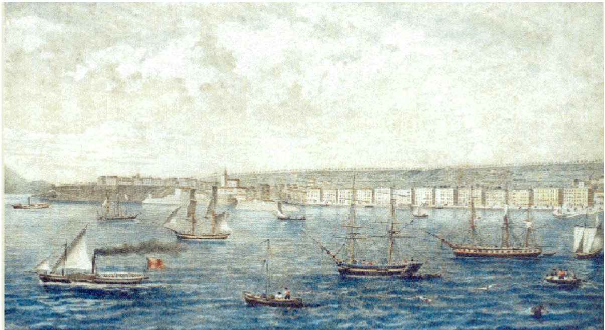
Núm. 4 . Litografía francesa publicada en Marina Civil (Núm. 54). Puerto de Santander hacia 1860, entonces puerto de Castilla y León. Muestra al Santander del comercio harinero con América.