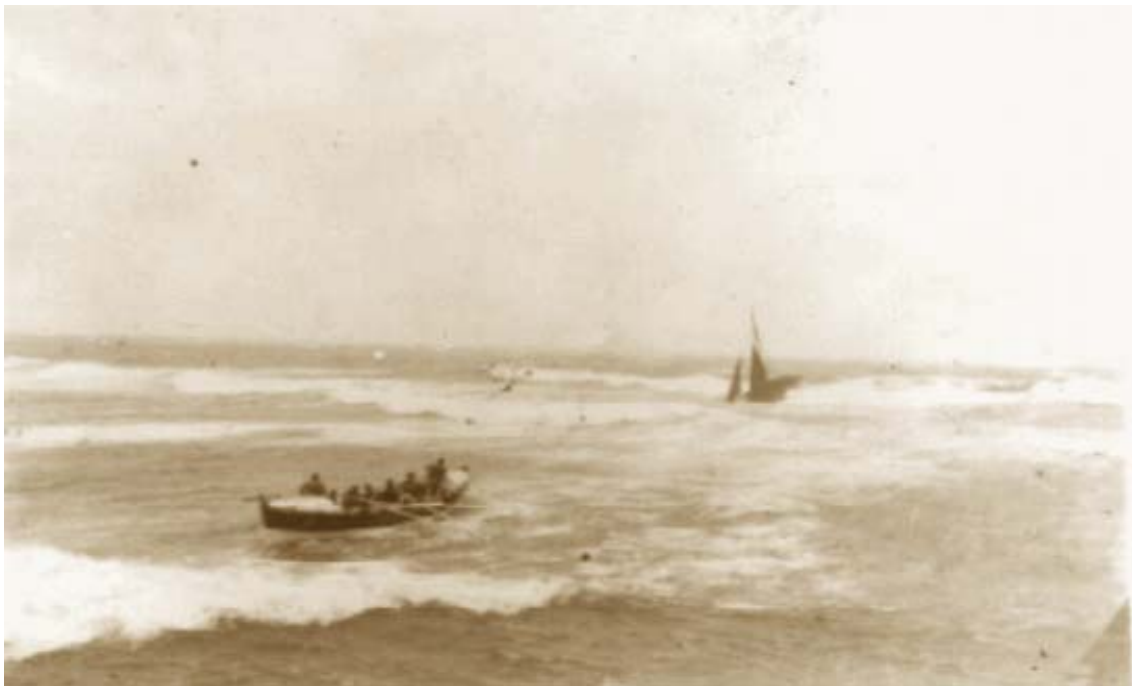
Núm.7 . Salvamento de un velero en apuros.