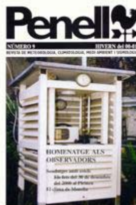
Portada de la revista Penell

a) Revista PENELL (3-4 números al año). Es la publicación de la entidad, y que intenta satisfacer a todos los asociados. Por ello hay artículos variados: científicos de investigación, de divulgación, explicaciones sobre diversos observatorios, reseñas de libros y webs, etc... Pero todos ellos con un lenguaje no científico, para que todos los asociados puedan entender lo que se intenta explicar.