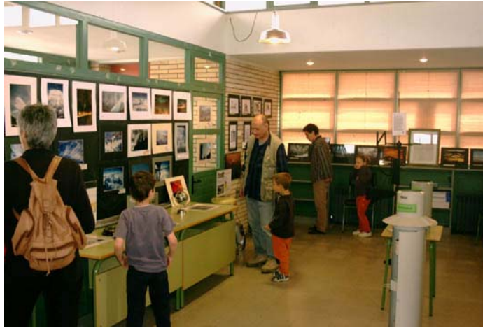
Exposición organizada por el ACOM

El objetivo de esta la Setmana Catalana de Meteorologia –Meteocat es, por un lado divulgar la meteorología mediante conferencias que tratan de temas actuales en investigación, por otro crear un espacio de reflexión sobre algún tema mediante la mesa redonda. Así mismo, se intenta que los no tan aficionados entren en este mundo mediante la convocatoria de los concursos y exposiciones de fotografías y videos (fotomet y videomet). También se intenta motivar a los estudiantes (desde primaria a los universitarios) y aficionados en general a que realicen investigación, y participen en el concurso de trabajos meteorológicos (Trellsnet). En definitiva, una semana completamente dedicada a la meteorología desde muchos ámbitos, y que cada año intentamos ampliar con nuevas actividades.