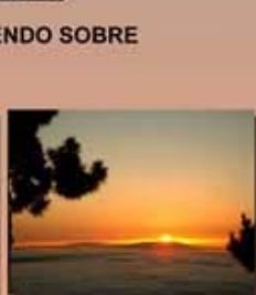
DESDE TENERIFE