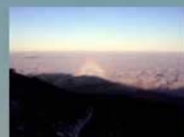
GLORIA EN EL MAR DE NUBES

LAS ISLAS CANARIAS ROMPEN LAS NUBES BAJAS QUE ARRASTRAN LOS VIENTOS ALISIOS, FORMÁNDOSE EL MAR DE NUBES AL NORTE Y CURIOSAS ONDAS AL SUR