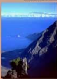
DESDE EL HIERRO