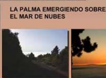
DESDE LA GOMERA