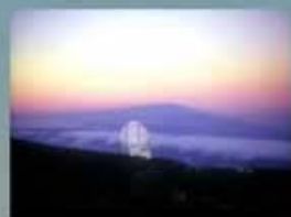
LA SOMBRA DE LA PALMA PROYECTADA EN EL HORIZONTE SOBRE EL MAR DE NUBES