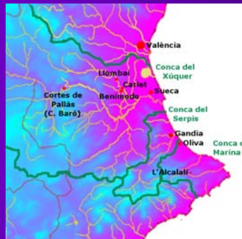
Figura 2. Área de estudio. Localización de las estaciones con los últimos registros históricos de las cuencas del Júcar, Serpis y Marina Alta, según la Confederación Hidrográfica del Júcar (CHJ) y el AEMET

Donde P(t) es la precipitación acumulada en t minutos, y I(t) es la intensidad media máxima en el mismo tiempo