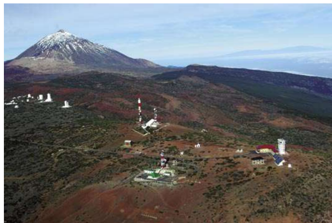
El 5 de junio se celebró, en el Observatorio de Izaña (Tenerife), el Día Mundial del Medio Ambiente.