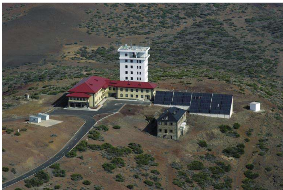
El Observatorio de Izaña tiene gran importancia mundial debido a su estratégica y privilegiada posición geográfica.