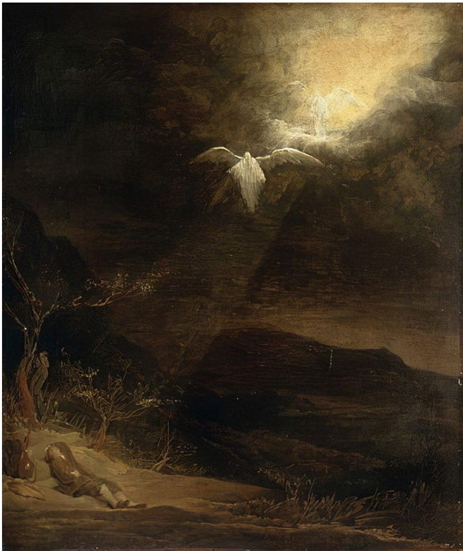
Figura 5: "El sueño de Jacob", del pintor barroco holandés Aert de Gelder (1645-1727)

Se han estudiado con detalle las civilizaciones más antiguas, y en la mayoría aparecen escenas, relatos, mitos, sucesos... de cierto parecido entre sí, y que representan imágenes de seres con poderes divinos vinculados con el cielo. Los arqueólogos suelen explicar razonablemente y con fundamento estas historias, pero también se han propuesto teorías que efectivamente establecen una relación entre las mismas y contactos reales con seres extraterrestres, sin necesidad de caer en fantasías incoherentes; por ejemplo el estudio de la civilización sumeria desvela unos orígenes muy misteriosos y sugerentes de origen ¿no humano?, y que transmitieron otras civilizaciones posteriores (acadios, babilonios, asirios, persas...). Otras civilizaciones antiguas, desde las del extremo oriental de Asia hasta las precolombinas en América, pasando por las culturas antiguas de la Polinesia, también muestran en sus mitologías sucesos, acontecimientos y representaciones de contenido similar.