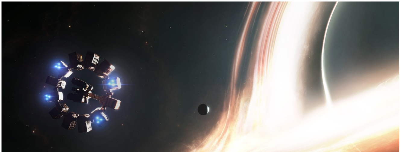
Figura 6: Nave 'Endurance' en las proximidades del planeta de Miller en órbita alrededor del agujero negro supermasivo 'Gargantúa', de la película 'Interstellar'

A este respecto, científicos como el astrofísico N.S.Kardashev (1932-2019) piensan que en muchas radiogalaxias puedan encontrarse civilizaciones del tipo III.