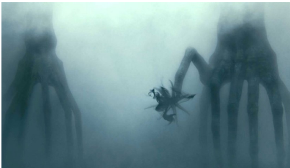
Figura 2: Imagen del film 'La Llegada', con los Heptápodos comunicándose con los Humanos