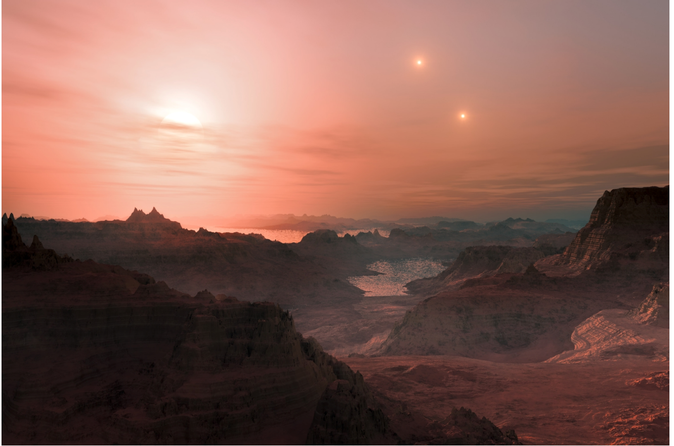
Figura 3: Recreación artística de un planeta extrasolar

Merece la pena señalar que, incluso dándose las condiciones señaladas anteriormente, existen factores que harían inhabitable el planeta en cuestión, como unos altos niveles de radiactividad o radiación ionizante provenientes de materiales de su superficie o del espacio exterior, una entrada de meteoritos muy alta, excesiva actividad eléctrica en su atmósfera, alta frecuencia de terremotos o un vulcanismo demasiado intenso.