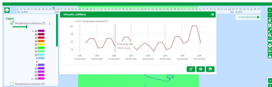
Fig.2. Ejemplo de sistema MEET desarrollado dentro del proyecto CRISI-ADAPT II

La metodología empleada para la estimación meteorológica se ha hecho empleando correcciones lineares y geométrica. En función de la variable a simular, se ha empleado el método que mejores resultados mostraba en cada caso de estudio. En el caso de la predicción a corto plazo, para cada punto se genera una predicción meteorológica a 7 días vista (fig.2), no solo de las principales variables meteorológicas sino también, de todas las variables derivadas (como días con temperatura superior a un umbral o días con precipitaciones superiores a una cantidad) que puedan ser de utilidad para el caso en seguimiento.