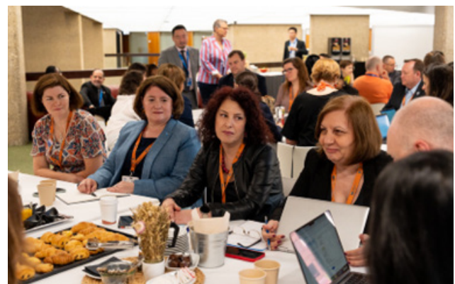
Desayuno de Diálogo sobre el Género celebrado durante el Congreso Meteorológico Mundial de 2023

Para abordar estas cuestiones, la OMM ha aumentado su compromiso con las medidas para la igualdad de género y con el empoderamiento de las niñas y las mujeres, no solo por una cuestión de equidad y justicia, sino también para hacer frente a los retos del cambio climático, la reducción del