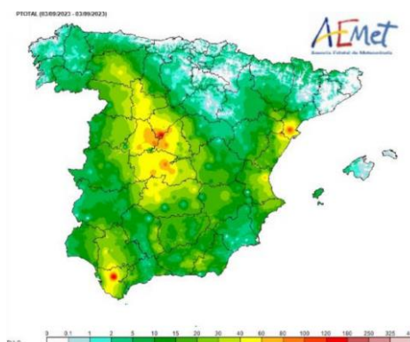
Figura 1 - Precipitación acumulada el día 03/09/2023. Composición elaborada en base a estaciones de AEMET.

La DANA que afectó a principios de septiembre de 2023 afectó a amplias zonas de la península. Especialmente importantes fueron las precipitaciones en la zona de la desembocadura del Ebro, zona de Cádiz y centro peninsular (Figura 1). Este tipo de fenómenos de alta intensidad son características de las zonas mediterráneas en otoño y también pueden afectar a otras zonas costeras. Sin embargo, no es tan habitual que la zona centro se vea afectada por este tipo de fenómeno con tanto impacto.