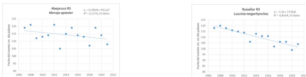
Figura 3 - Rectas de regresión y coeficientes de determinación para el estadio R3 obtenidas a partir de 15 años de datos, abejaruco (izquierda) y ruiseñor (derecha).

En la Figura 2 se muestran los resultados obtenidos para el estudio del inicio de la brotación de las hojas (07) de Malus domestica (manzano) y de Populus nigra (chopo negro o álamo negro). Ambos eventos muestran una ligera tendencia al retraso con una R^2 de 12,20 % (ligera) y un p-valor de 0,07, en el caso del manzano y una R^2 del 12,54 % (ligera) y un p-valor de 0,07, en el caso del chopo o álamo negro.