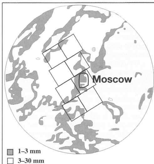
Figura 3 — Imagen digital de radar (diagrama simplificado) de la precipitación desde las 0600 TU hasta las 2300 TU del 9 de mayo de 1995 en un radio de 200 km alrededor de Moscú (Sistema de radar AKSOPRI de Krylatskoye)

a sotavento, con los que se esperaba apreciar el impacto; los cuadrados 7 y 8 constituyen un par similar de cuadrados salvo por el hecho que no existió siembra en el cuadrado 7.