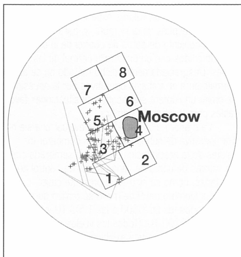
Figura 2 — Zonas de siembra de nubes y distribución de ocho cuadrados empleados para evaluar el impacto de la siembra del 9 de mayo de 1995 (+ = zona en la cual las nubes se sembraron con polvo grueso; - = zona en la que las nubes se sembraron con agentes formadores de hielo).