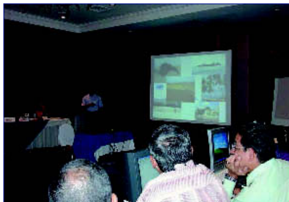
Seminario Regional sobre Cambio Climático en Guatemala, en noviembre de 2004

mental de la UNESCO) y el Instituto Interamericano de Investigación del Cambio Mundial.