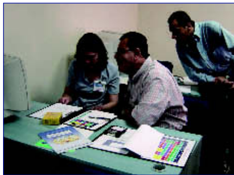
Seminario Regional sobre Cambio Climático en Turquía, en octubre de 2004

Estos seminarios fueron posibles por el generoso apoyo financiero del Departamento de Estado de los EE.UU., el SysTem de Análisis, Investigación y Formación Profesional, el Programa Mundial de Investigaciones Climáticas (copatrocinado por la OMM, el Consejo Internacional de Ciencia y la Comisión Oceanográfica Interguberna-