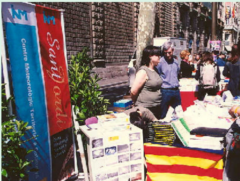
El CMT en Cataluña estuvo presente, con publicaciones del INM, el día de San Jordi durante la Feria del Libro, en las Ramblas barcelonesas.