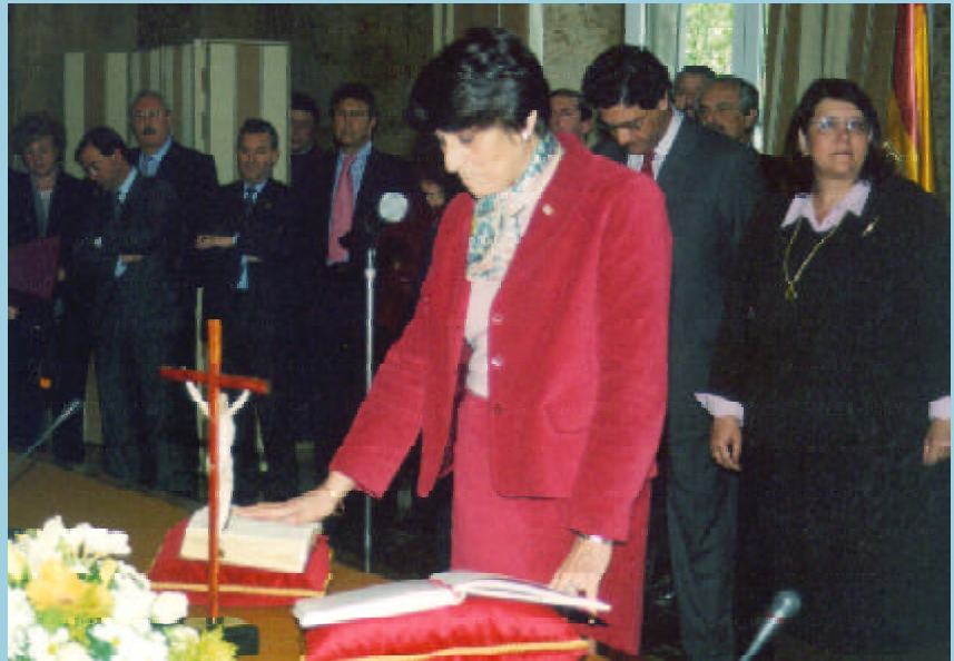
La nueva Directora General toma posesión ante la Ministra.

Tras la clausura del Congreso tendrá lugar la reunión anual del Consejo Ejecutivo de la OMM, del 26 al 29 de mayo.