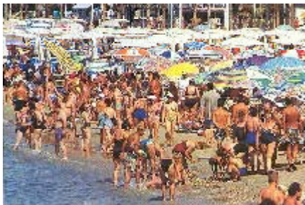
Los bañistas encontraron el agua más cálida

El verano pasado presentó un carácter marcadamente cálido, con anomalías en las temperaturas medias y el registro de numerosas efemérides en temperaturas máximas y mínimas. Esta situación ha afectado también a las temperaturas de las aguas del mar y muy singularmente a las del Mediterráneo.