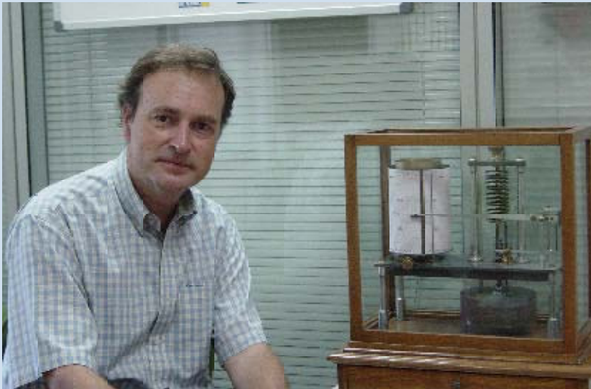
Desde Sevilla, el nuevo responsable del Centro afronta el reto con ilusión