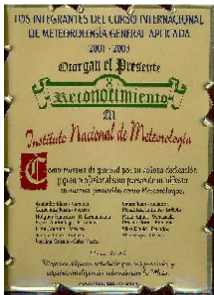
Los alumnos otorgaron esta placa de agradecimiento al INM

Después de unas breves palabras de bienvenida y felicitación de la Directora General, se procedió a entregar, a los 13 alumnos becarios, el diploma de Técnico en Meteorología General Aplicada, el primero que se entrega bajo esta fórmula, tras las 26 promociones con la denominación de Meteorólogo Clase II-OMM. Este curso ha contado con 3 alumnos de México, 2 de Bolivia, 2 de Ecuador, 1 de Venezuela, 1 de Namibia, 1 de Cabo Verde, 1 de Guinea, 1 de R. Dominicana y 1 de Rumanía, que han superado los dos años académicos de que consta, con aproximadamente 1.200 horas teórico-prácticas, además de la realización de una fase de prácticas en distintas unidades técnicas del INM y de una memoria final.