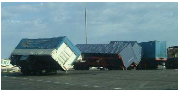
El «reventón frío» del 5 de septiembre en la Marina Alta (Alicante) tuvo fuerza para volcar contenedores y derribar árboles (Más información en la página 5)

En relación con la distribución de las precipitaciones a lo largo de las distintas estaciones del año hidrometeorológico, se destaca que el trimestre otoñal fue muy húmedo en todas las zonas de la vertiente atlántica, sobre todo en Galicia, Castilla y León y oeste y sur de Andalucía, dado el claro predominio de las situaciones de poniente, en tanto que por dicho motivo resultó más bien seco en las distintas zonas