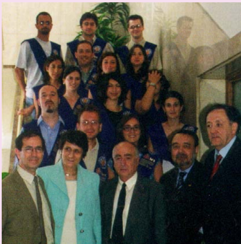
Los alumnos, con la Directora General y los profesores.