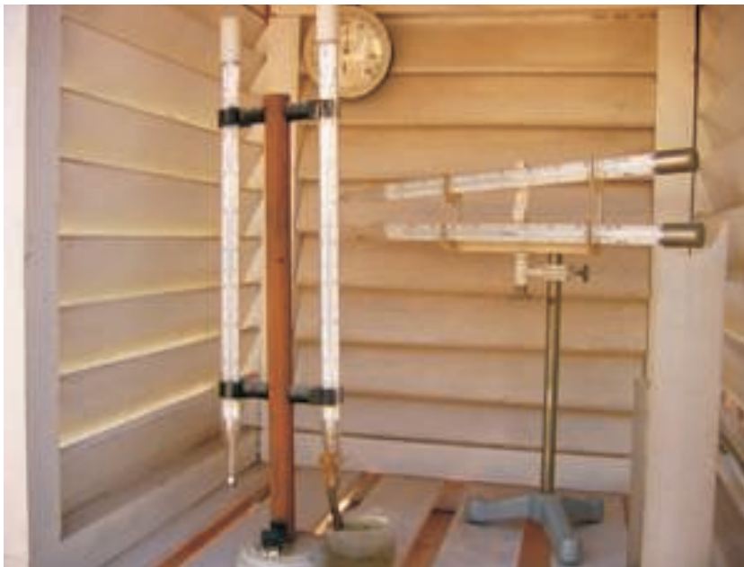
Garita meteorológica del observatorio de meteovalencia