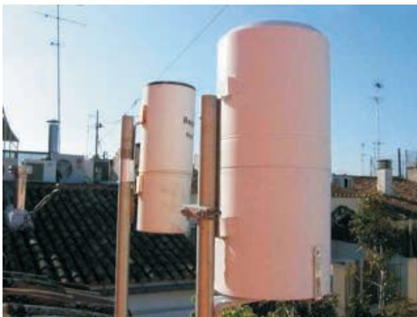
Pluviómetros Hellmann de 200 y de 120 mm del observatorio de meteovalencia