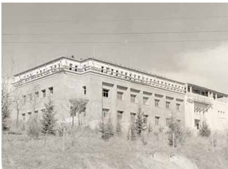
Figura 3. Construcción del edificio de la Ciudad Universitaria, zona sur de la fachada, hacia 1961.

En 1959 el Ministerio del Aire alcanzó un acuerdo con el Ministerio de Educación y la Universidad, que cedió unos terrenos a escasa distancia de la Facultad de Ciencias. Se trataba de la ladera sur del llamado «Cerro de los Locos», una denominación informal que aludía a los entusiastas del deporte al aire libre que, escasos de ropa, frecuentaban el cerro desde principios del siglo XX, cuando esas actividades no tenían el arraigo social que disfrutarían más tarde. Durante el asedio de Madrid en la guerra civil el cerro estuvo siempre en la zona republicana inmediata al frente y era una posición estratégica, por lo que fue intensamente bombardeada por la artillería y la aviación rebeldes. Aún hoy en día pueden contemplarse los agujeros de los obuses y seguirse las marcas de las trincheras que ahora se aprovechan para circuitos de «trekking» ciclista. Esa zona alta de la ciudad universitaria siguió sin edificarse durante bastante tiempo. Existía un camino llamado «de las Morenas» que unía la zona de las facultades con los barrios del noroeste. A final de los años 50 se asfaltó y en 1959 se construyó el edificio más próximo a la sede de la Agencia, el Colegio Mayor Santo Tomas de Aquino, que recibió el Premio Nacional de Arquitectura por su novedoso diseño.