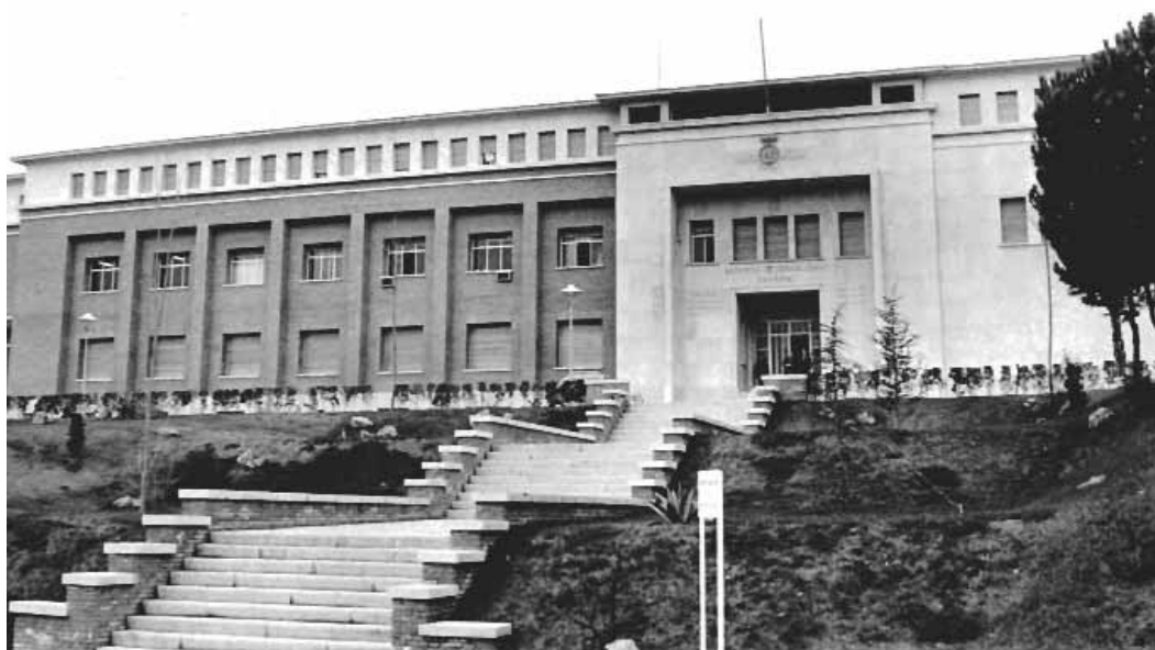
Figura 6: Cuerpo delantero del edificio poco después de inaugurarse.