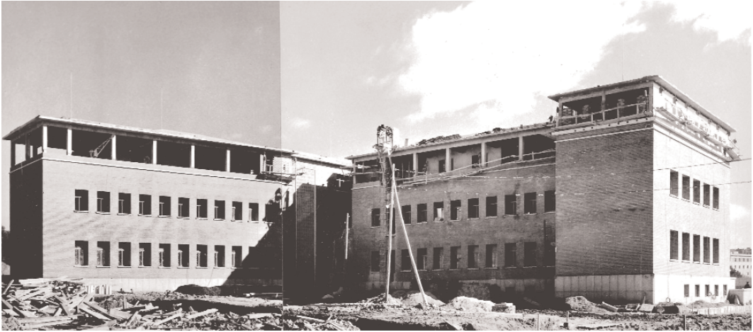
Figura 4. Esta composición de fotografías muestra las obras de construcción del edificio en su zona trasera donde ahora están los barracones para los cursos de formación.