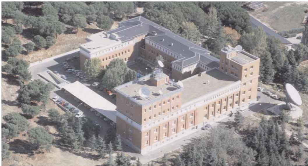
Figura 8. Vista aérea actual del edificio de la Ciudad Universitaria. El ala con las dos torres corresponde a las dos ampliaciones posteriores a la construcción. Además se retiró parte del tejado de pizarra en el ala norte para disponer de otra terraza para instrumentación. La gran antena exterior data de los años ochenta.

Con las dos ampliaciones se ganó bastante espacio, pero el Servicio siguió creciendo e incorporando nuevas infraestructuras como los modernos sistemas de computación. Como es lógico, además de las dos ampliaciones citadas, en el interior del edificio se han ido realizando muchas otras reformas para adaptar el espacio disponible a su utilización y a otras necesidades. Se ha oído con frecuencia que por su encuadre en la Ciudad Universitaria no se autorizarían nuevas ampliaciones, lo que ha obligado entre otras medidas a emplazar barracones provisionales para los cursos de formación, pero lo cierto es que podría haberse propuesto una nueva ampliación en el último plan de edificabilidad de la zona, que se aprobó a final de la década de los ochenta; la propuesta no se presentó, posiblemente por negligencia. A principios de los años noventa llegó a estar muy avanzada la idea de trasladar la sede a Paracuellos del Jarama, en base a una oferta de la Dirección General de Aviación Civil, pero finalmente no fructificó.