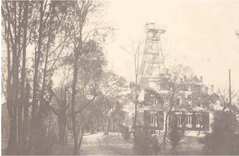
Figura 2. El edificio de 1913 poco después de su construcción, con una enorme estructura metálica para la instalación de anemómetros y el lanzamiento y seguimiento de globos con teodolito

Después de la guerra se construyó un nuevo edificio de dos plantas entre los dos anteriores, donde se instalaron la biblioteca y otras secciones y que el personal conocía festivamente como «Pasapoga», aludiendo a una sala de fiestas de moda en el Madrid de la posguerra. Un almacén y otras instalaciones reducidas completaban el pequeño complejo del Parque del Retiro donde, hasta los años sesenta del pasado siglo estuvo la sede del Servicio, la «Oficina Central» como se denominó oficialmente hasta 1978, siguiendo la nomenclatura recomendada por la Organización Meteorológica Internacional. Tras el traslado a la Ciudad Universitaria siguieron allí algunas secciones y el centro regional (primero «Centro del Tajo», luego «Centro Meteorológico de Madrid y Castilla - La Mancha» y actualmente «Delegación en Madrid»).