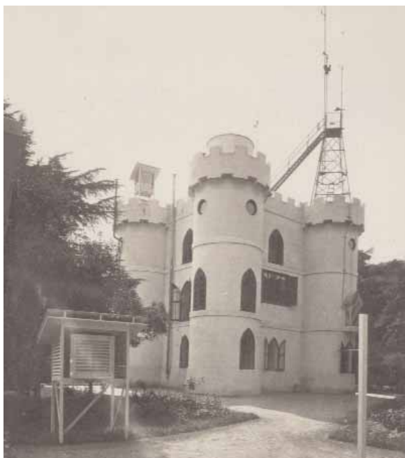
Figura 1. «El Castillo» en una imagen de principio del siglo XX. Puede verse la torre metálica para medición de viento y una de las garitas de observación en primer plano (se distingue otra en una de las torres).

En 1911 se inició una época de rápido desarrollo para el Servicio, que había pasado a llamarse Observatorio Central Meteorológico. Bajo el impulso del segundo director, José Galbis, se obtuvo del gobierno un importante aumento de los recursos disponibles y del personal. La única dependencia propia era entonces la del Retiro ya que los observatorios de provincias estaban instalados en universidades, institutos y otras instituciones, y «El Castillo» se quedó pequeño para acoger el aumento de personal y actividades. En poco tiempo se construyó un edificio bastante más grande, unos 50 metros al norte del Castillo, que estuvo terminado en 1913. Tenía dos plantas, que años más tarde se aumentaron con una tercera, y ofrecía espacio de sobra para las nuevas instalaciones, aunque parte del edificio se dedicó a viviendas para personal, según una costumbre habitual en aquella época en los locales de muchos organismos técnicos. Hubo que esperar hasta cerca del final del siglo XX para aprovechar también ese espacio que durante más de 80 años fue usado como vivienda familiar del Jefe de la Oficina Central y de otros directivos. También había una vivienda para el conserje principal.