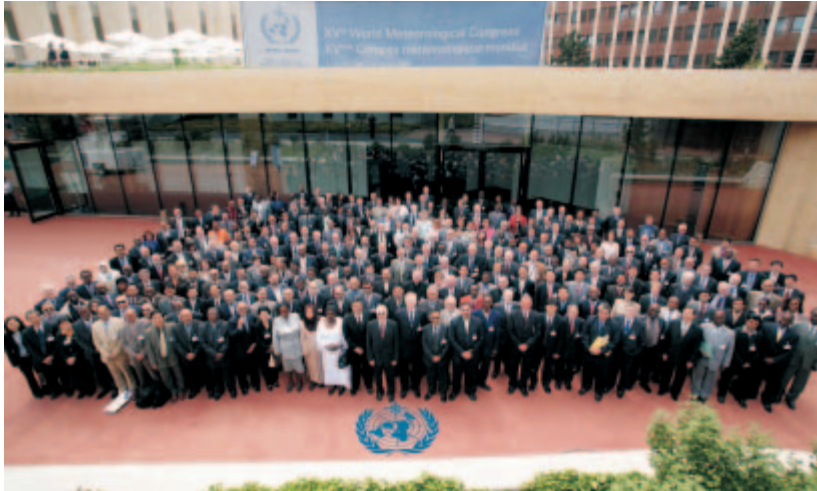
Los participantes ante la sede del Congreso de la OMM

La candidatura del Director del INM fue la más votada