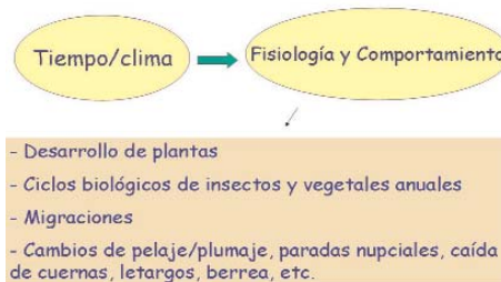
Tiempo/clima: factores abióticos

vaciones fenológicas se utilizan para la investigación agrícola o ecológica, la toma de decisiones relacionadas con las labores agrícolas, para los estudios del clima regional, y últimamente se está resaltando su importancia como indicadores de cambio climático. En la observación fenológica con fines climatológicos se deben utilizar especies silvestres en un ambiente natural que además reúnan las siguientes características: