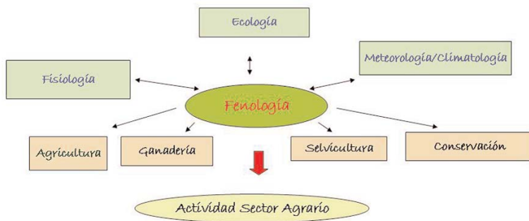
Ciencias y técnicas asociadas con la fenología

una cierta especie presenta una sensibilidad máxima a un determinado elemento meteorológico. Los datos obtenidos reflejan la cronología de la aparición o comienzo de una determinada fase en un espacio geográfico concreto y se suelen reflejar mediante las isofenas o líneas de igual fecha. Estos datos se utilizan como descriptores tanto del clima local como del funcionamiento de los agrobiosistemas y ecosistemas naturales en los que influye.