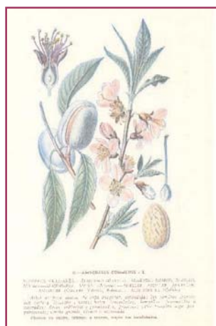
Portada y ejemplo de lámina (almendro) del Atlas para las Observaciones Fenológicas de 1943.

los aficionados a la observación de la naturaleza para llegar a confeccionar un mapa fenológico de España; pero fue en agosto de 1942 cuando la Sección de Climatología de la Oficina Central del Servicio Meteorológico Nacional distribuyó unas instrucciones tituladas "Las observaciones fenológicas, indicaciones para su implantación en España", escritas por el meteorólogo José Batista Díaz; en este manual se fundamentaba el interés de la fenología y se realizaba un llamamiento a la colaboración por parte de los observadores de las estaciones meteorológicas, de los organismos dependientes del Ministerio de Agricultura y, en general, de personas que vivieran en contacto con el campo, en beneficio del conocimiento del clima y de las mejoras en agricultura; además se indicaban las bases de este tipo de observaciones y se presentaba una lista de especies de plantas, aves e insectos, elaborada en base a las propuestas de J. Edmund Clark, del Comité Fenológico de la Royal Meteorological Society, y de los Drs. Bos, de Wageningen y Pinkhof, de Amsterdam; también se tuvieron en cuenta especies características de la península Ibérica, para ello se siguieron las indicaciones del Director del Jardín Botánico de Madrid, Arturo Caballero, y del entomólogo del Museo de Ciencias Naturales de Madrid, Ramón Ajenjo.