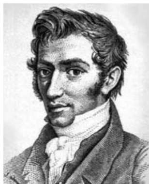
El matemático, astrónomo y sociólogo belga Lambert Adolph Jaques Quètelet, pionero en la fenología.

cotonero, dispersos desde el siglo XVIII; estas observaciones tenían relación con viejos festivales. En Europa los datos fenológicos más antiguos que se conocen aparecen en el diario meteorológico de Egioké (Reino Unido); aunque las primeras observaciones realizadas con un cierto método son las que empezaron de forma individual Robert Marshan (Inglaterra