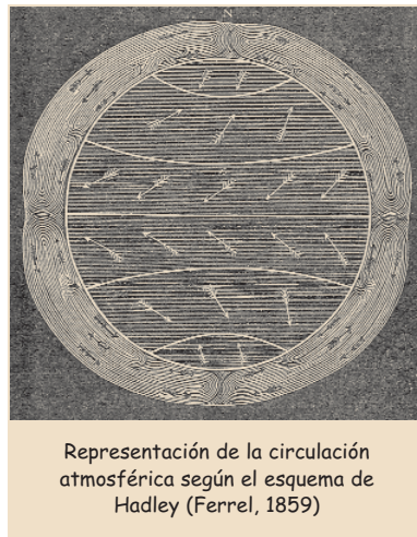
Representación de la circulación atmosférica según el esquema de Hadley (Ferrel, 1859)

Vemos, pues, que Kant redescubre en su esencia el argumento de Hadley (1735). Ambos ensayos son de rara concisión, pero mientras Hadley se propone exponer un principio novedoso con la mayor brevedad posible, Kant busca abarcar en una sola teoría las causas de todos los vientos regulares conocidos. El encanto del ensayo de Kant estriba en que trata de reducir la plétora típica de un Musschenbroek a unos pocos principios racionales.