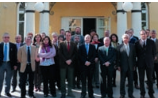
Equipo directivo y delegados

Durante los días 16 y 17 de abril se celebró en Málaga la segunda reunión de este año del Equipo Directivo de la Agencia con los Delegados Territoriales de AEMET. Entre los temas más importantes tratados figuran el desarrollo del Contrato de Gestión de la Agencia, los avances en la estructuración de las Delegaciones Territoriales, la presentación de la nueva estructura de la Dirección de Producción e Infraestructuras, la situación del proceso de selección de observadores interinos, el anuncio de nuevos concursos, la situación de las auditorías del Cielo Único y las tendencias mundiales en cuanto a la libre disposición de datos meteorológicos en relación con los servicios de valor añadido de los Servicios Meteorológicos.