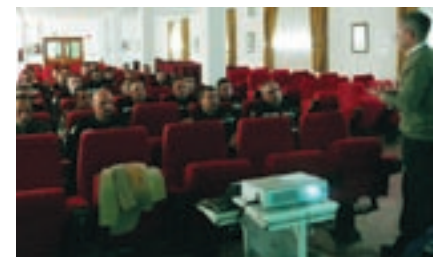
Aula de formación para los militares

- El catálogo de los datos y productos distribuidos bajo licencia para reutilización en el marco de aplicación de la directiva PSI.