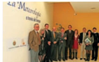
El Presidente de AEMET con los organizadores

«La Meteorología a través del tiempo» se renueva en Valladolid