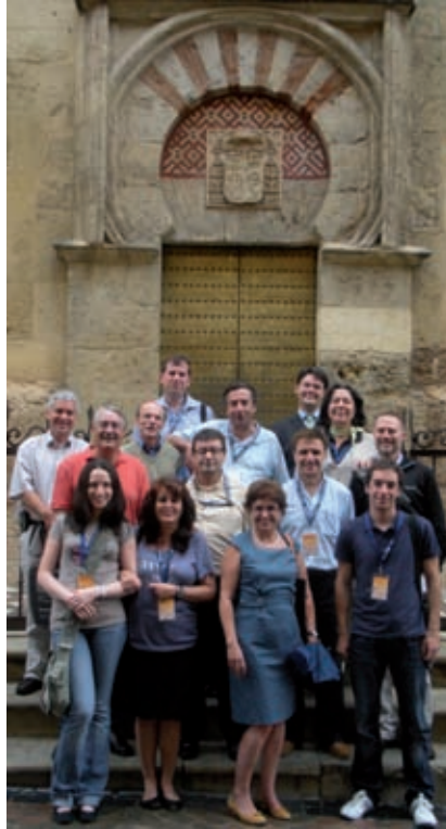
Participantes de AEMET, ante la mezquita