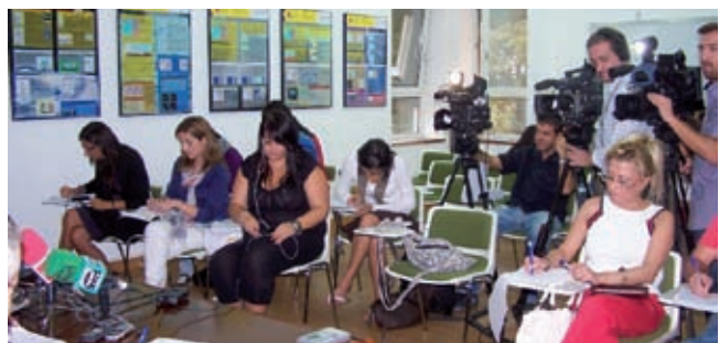
Castilla y León