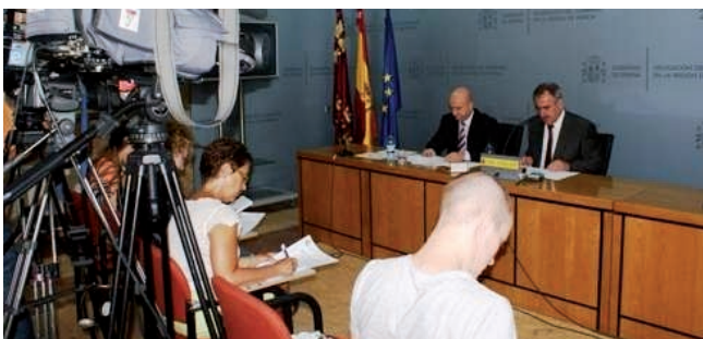
Región de Murcia