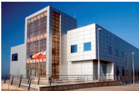
Sede de la DT en Cantabria