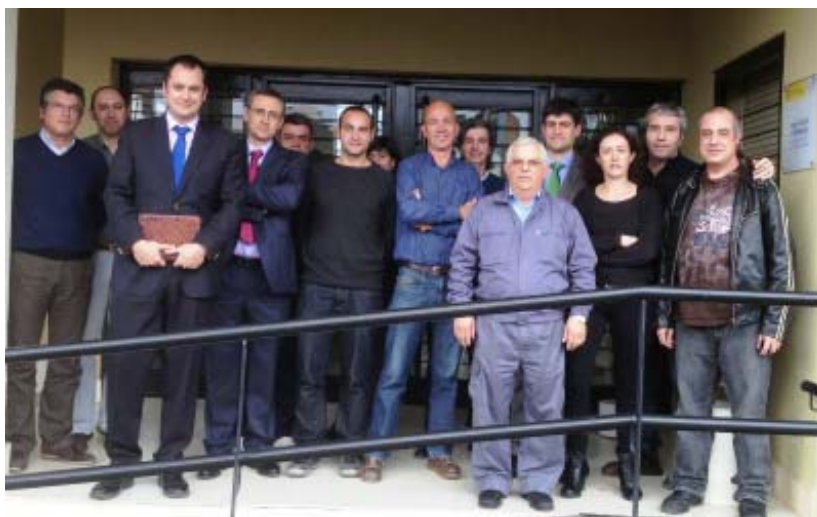
Con el personal de la delegación territorial de la Agencia