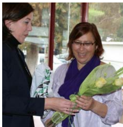
Merche le entrega un ramo de flores

Siempre recordaremos su gran profesionalidad, extraordinario compañerismo y lo excelente persona que es. Lo vamos a echar mucho de menos. Le deseamos que disfrute de lo mejor en esta nueva etapa de su vida. Con cariño, tus compañeros de la O.M.A. del Aeropuerto de Gran Canaria.