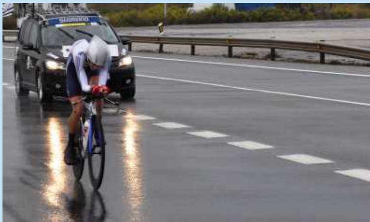
Un ciclista soporta la lluvia en pleno esfuerzo

Del 21 al 28 de septiembre se celebraron en Ponferrada (León) los Campeonatos del Mundo de Ciclismo en Ruta 2014. La Agencia, a través de su Delegación Territorial en Castilla y León, ha sido el proveedor oficial de la información meteorológica. Se firmó un convenio de colaboración entre AEMET y el Ayuntamiento de Ponferrada, organizador de la competición, con el fin de contribuir a la seguridad del evento, tanto de los propios corredores como de la multitud de espectadores y visitantes que atrae un acontecimiento de estas características.