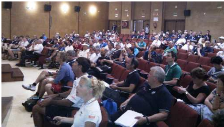
Concurrido «briefing» matutino en el que se ofrece la predicción

También, se ofrecieron campos de corrientes superficiales, con periodicidad horaria hasta 48 o 72 horas a través de nuestra página pero provenientes del Instituto de Hidráulica Ambiental de Cantabria, institución de investigación de alto nivel que dispone de estas