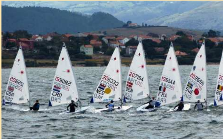
Regatistas de vela olímpica compiten en la bahía de Santander