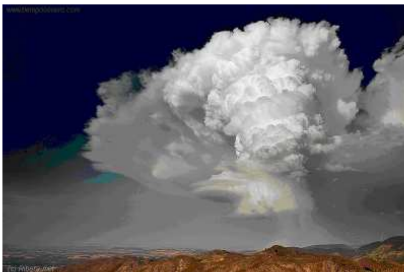
Supercélula anticiclónica en Ribafrecha (La Rioja), 1 de Julio de 2009

Una identificación categórica de una supercélula se puede realizar a partir de la observación radar, cuando se localiza la rotación del mesociclón (o mesoanticiclón) a partir del producto viento radial Doppler , en el que se debe comprobar la existencia de dos máximos relativos de viento opuestos, muy cercanos y que cumplan la propiedad