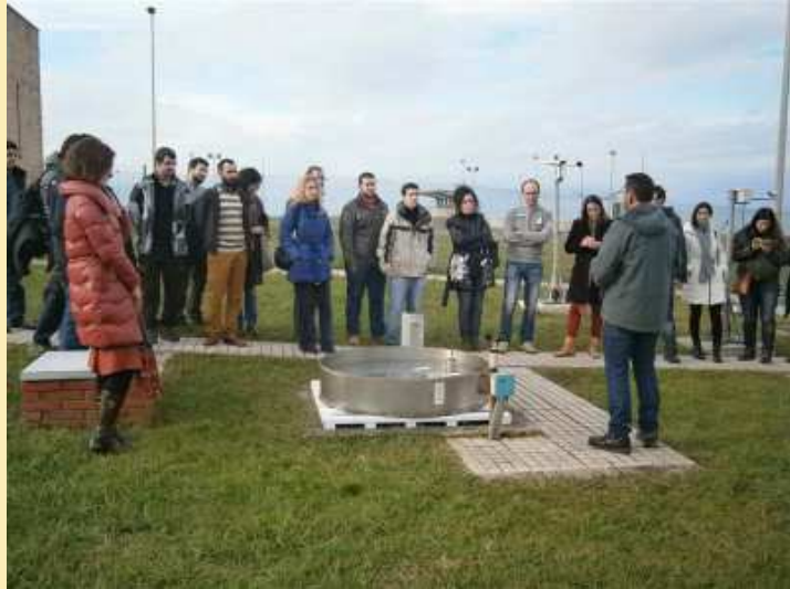
Los asistentes atienden las explicaciones del meteorólogo