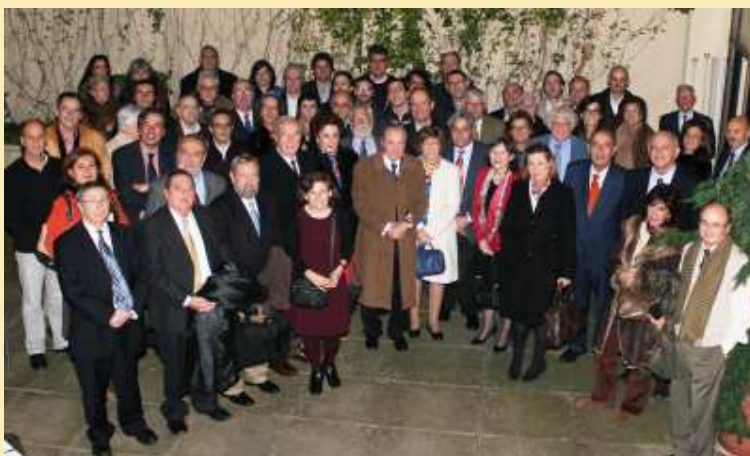
Todos los participantes en la conmemoración