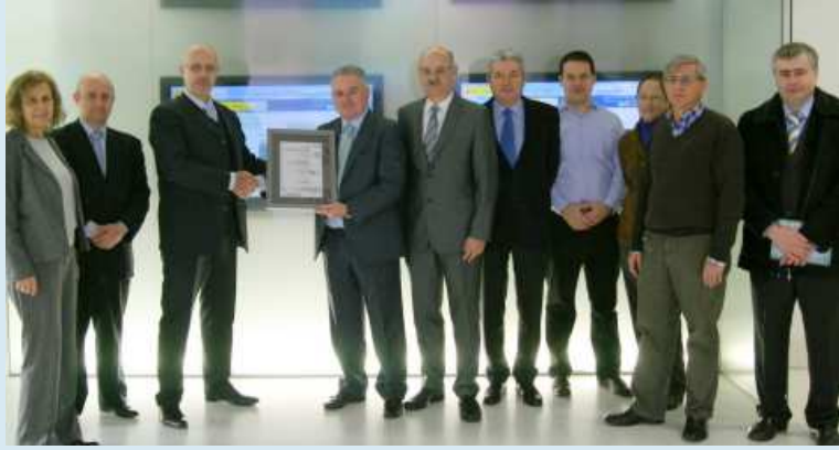
Momento de la entrega del certificado en la sala de predicción

El convenio garantiza la presencia de observadores meteorológicos de AEMET en el OE.