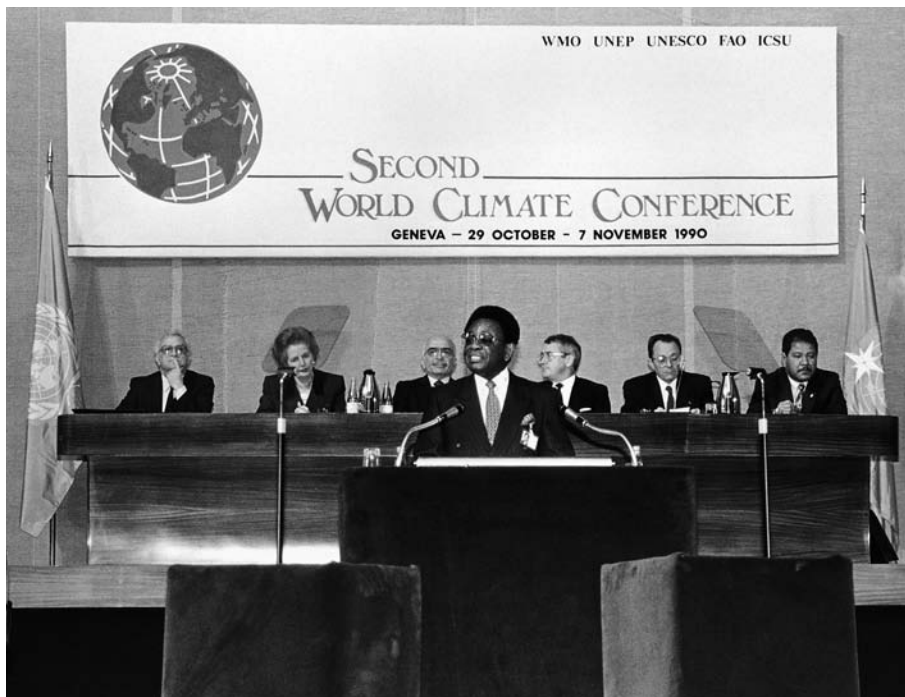
Figura 3 — El Secretario General de la OMM, G.O.P. Obasi, dirigiéndose a la audiencia en la apertura de las sesiones ministeriales de la Segunda Conferencia Mundial sobre el Clima, en el Palacio de las Naciones de Ginebra, el 6 de noviembre de 1990. Detrás de él se encuentran (de izquierda a derecha) el Hon. E. Fenech-Adami, Primer Ministro de Malta; la Muy Hon. M. Thatcher, Primera Ministra del Reino Unido; S.M. el Rey Hussein I de Jordania; el Canciller Federal A. Kölller, Presidente de la Confederación Helvética; M. Rocard, Primer Ministro de Francia; y el Muy Hon. B. Paeniu, Primer Ministro de Tuvalu.