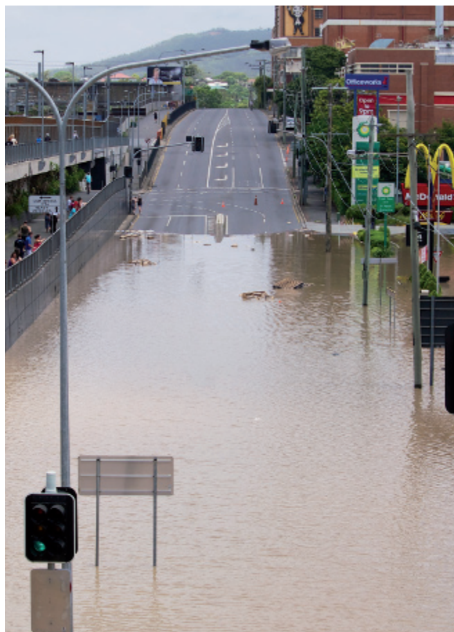
Crecida australiana de 2011

Las actividades de verificación de la predicción serán esenciales y servirán a varios propósitos incluyendo: (i) proporcionar información y orientación relativa a deficiencias y mejoras asociadas con cambios en los sistemas de predicción subestacional, lo que permitirá realimentar mejoras en el sistema; (ii) evaluar los