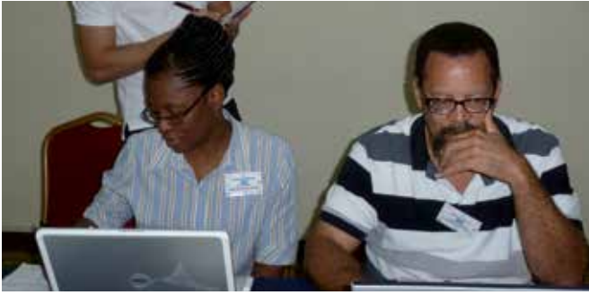
Participantes en el segundo taller regional que se celebró en Puerto España (Trinidad y Tabago) en mayo de 2013.

Por ejemplo, en el taller celebrado en el Caribe los expertos en clima y en salud aportaron ideas sobre temas que muchos de ellos reconocieron no haber abordado antes. Identificaron el dengue como una preocupación regional común. Esta enfermedad es habitual en el Caribe durante la estación lluviosa. Se necesitan sistemas de alerta temprana eficaces para advertir a la población vulnerable acerca de las medidas a adoptar para minimizar los riesgos de un posible brote. Las autoridades sanitarias necesitan que los servicios climáticos combinen las predicciones estacionales de lluvia, temperatura y humedad para prever los brotes de dengue. Esta información debe comunicarse con antelación de forma que las autoridades sanitarias puedan lanzar la oportuna campaña de divulgación.