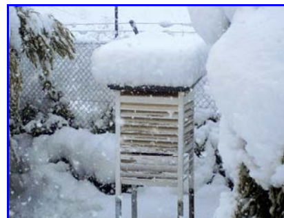
Nevada del 20 de marzo en la estación de Campo de San Juan, en Moratalla.

Durante el segundo y principal episodio, los días 19 y 20, las precipitaciones fueron generalizadas y persistentes, acumulándose más de 60 l/m 2 en zonas del noroeste, y llegándose a registrar 74 l/m 2 en Calasparra. En puntos de las comarcas del Altiplano, Vega Alta del Segura y Oriental, se superaron los 50 l/m 2 . Las precipitaciones fueron de nieve en cotas de hasta 500 metros, con espesores de más de 10 centímetros en amplias zonas de la región, y más de 50 centímetros en cotas altas.