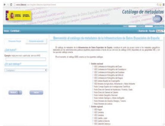
Catálogo de metadatos de la IDEE.

exista interoperabilidad, deben establecerse normas sobre los metadatos. La Norma Internacional de Metadatos es la ISO 19115, que define más de 400 elementos. En España se ha desarrollado el Núcleo Español de Metadatos (NEM) subconjunto de la anterior. Es una recomendación de metadatos para España que define el conjunto mínimo de elementos de metadatos necesarios para describir un recurso de información geográfica.