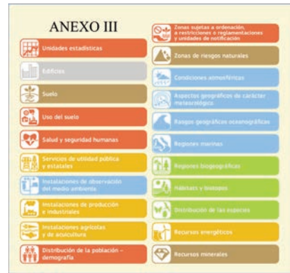
Anexo III de la directiva INSPIRE.

En LISIGE, los Datos Geográficos de Referencia están en el Anexo I e incluyen los datos recogidos en los anexos I y II de la directiva INSPIRE más las entidades de población.