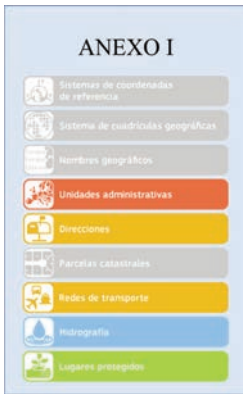
Anexo I de la directiva INSPIRE.