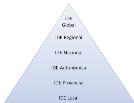
Estructura de una IDE por niveles.

La directiva INSPIRE se ha transpuesto al ordenamiento jurídico español mediante la ley 14/2010, de 5 de julio, sobre las infraestructuras