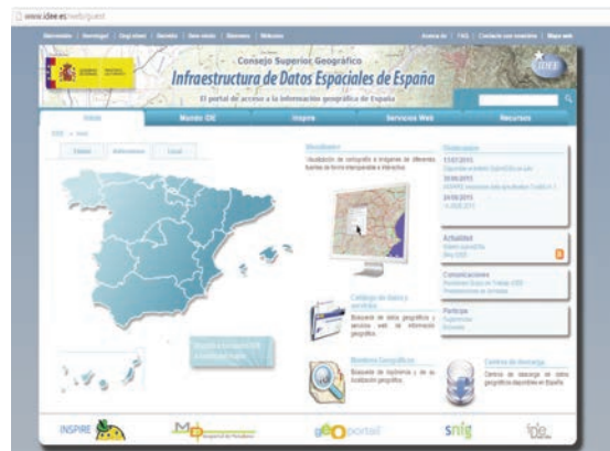
Portal de la Infraestructura de Datos Espaciales de España (IDEE).

En España, tanto la Administración del Estado como las administraciones autonómicas y las locales tienen capacidad de generar y gestionar la información geográfica que necesitan para su propio control y gestión. La IDEE integra los datos, servicios y metadatos geográficos que se producen en España a través de internet. La gestión de la IDEE es una función de la Dirección General del IGN, siendo el Consejo Superior Geográfico el punto de contacto de la Comisión Europea en España.