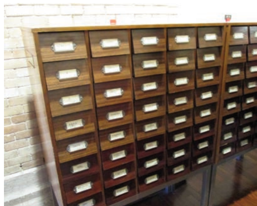
Ejemplo de catálogo en la Biblioteca Nacional de España.

Estas tareas se realizan en el catálogo. Es una interfaz web, aunque también puede ser un servicio en sí. Mediante criterios de búsqueda (espacial, temática) encontramos los datos