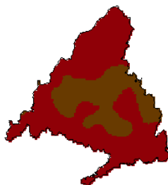
junio 2017: Anomalía de la temperatura media mensual respecto al periodo 1981-2010