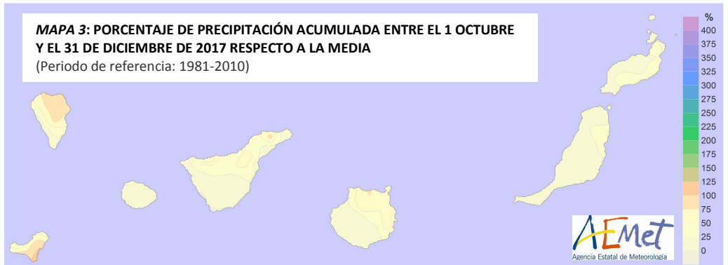
MAPA 3: PORCENTAJE DE PRECIPITACIÓN ACUMULADA ENTRE EL 1 OCTUBRE Y EL 31 DE DICIEMBRE DE 2017 RESPECTO A LA MEDIA (Periodo de referencia: 1981-2010)

Tanto en la estación de Izaña, con 268,5 horas de sol, como en la del aeropuerto Tenerife Sur [240,5 horas], se produjo un superávit de horas de sol del 24%. Este excedente es apreciable en todas las estaciones, salvo en los aeropuertos de La Palma y Tenerife Norte, que presentan déficits del 4 y 16%, respectivamente. La presión también se vio afectada por la escasez de perturbaciones, estando su valor medio en superficie casi 5 hPa por encima de la media. Asimismo, la evaporación experimentó valores entre un 25 y un 40% por encima del valor esperado. Se produjeron dos episodios de calima , el más importante de los cuales tuvo lugar entre los días 5 y 9, afectando a costas y medianías, donde la visibilidad se ve reducida hasta los 5 km.