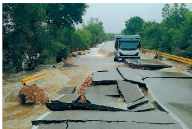
Crecida repentina en la ciudad de Zadar, 11 de septiembre de 2017