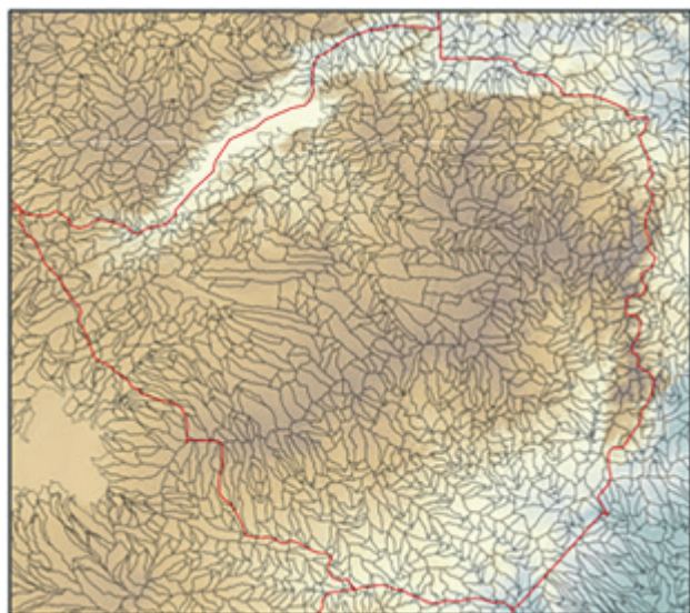
Mapa del relieve y las subcuencas de crecidas repentinas en Zimbabwe

extiende por un vasto terreno interior elevado cuya altitud desciende al norte en dirección a la cuenca del Zambeze. Es en esta área donde Zambia comparte frontera con Zimbabwe. Las elevaciones del terreno descienden también al sur hacia la cuenca del río Limpopo y la frontera con Sudáfrica.