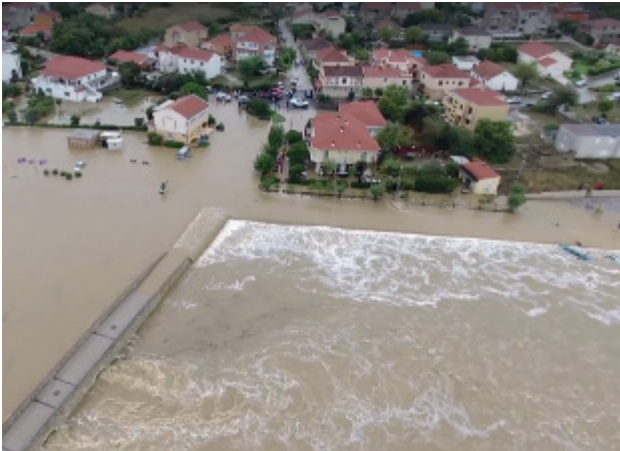
Crecida repentina en la ciudad de Nin, 11 de septiembre de 2017

Los efectos de las riadas repentinas pudieron haber sido peores, pero estas fueron bien pronosticadas y se emitieron alertas con anticipación. El Servicio Meteorológico e Hidrológico Nacional difundió varias alertas de crecida repentina a la Dirección Nacional de Protección y Salvamento, así como a la población y a los medios de comunicación a través de Meteolarm. El Sistema Guía para Crecidas Repentinas de Europa suroriental fue muy preciso, mostrando la localización exacta de las avenidas.