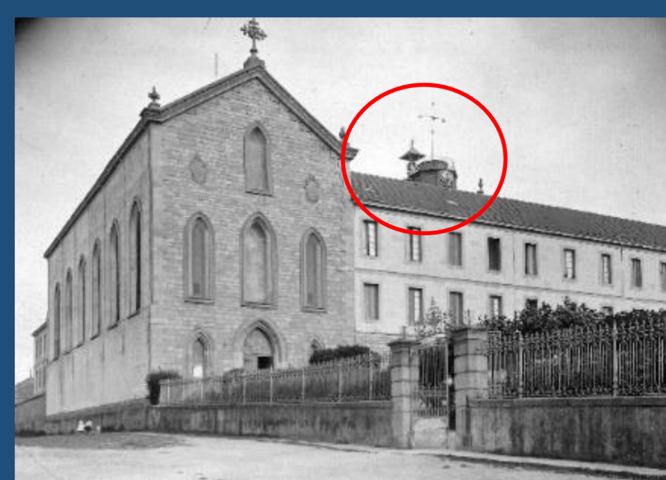
Colegio La Inmaculada de Gijón, en cuyo torreón se instaló un observatorio meteorológico a finales del siglo XIX y tarjeta pluviométrica mensual de mayo de 1915.